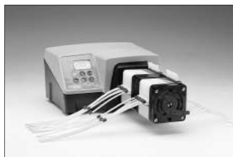
323U/MC4 + 314MCX